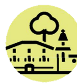
Ajuntament de El Morell