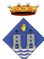
Ajuntament de Torredembarra